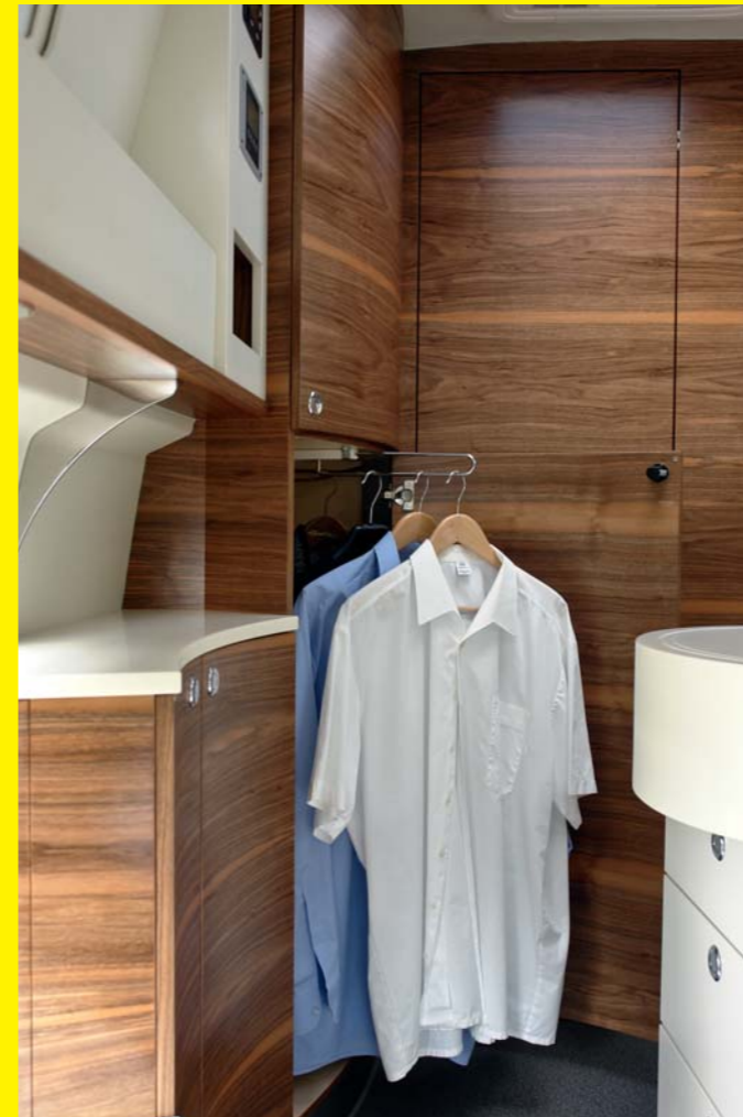
Der Kleiderauszug erleichtert den Zugriff auf Ihre Garderobe

Die Fotos zeigen teilweise Sonderausstattung.