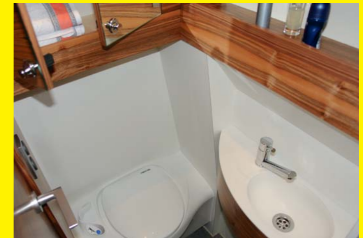
Sanitärbereich mit Kassettentoilette, Mineralwerkstoffwaschtisch