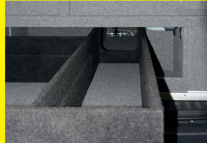
Großer Stauraum im doppelten Boden (optional mit Stauraumschublade), Zugang über die Hecktüren.