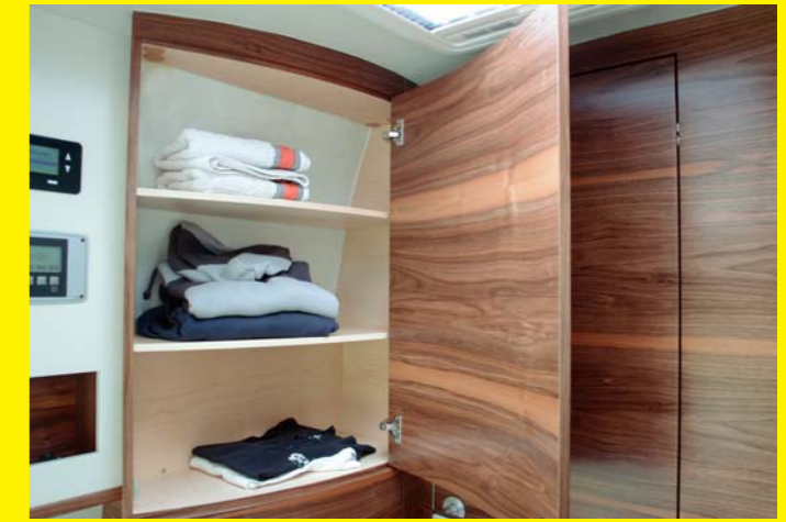
Im Wäscheschrank ist jede Menge Platz