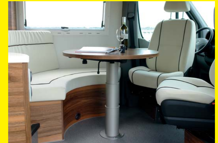
Die Sitzgruppe bietet vier Personen ausreichend Platz.