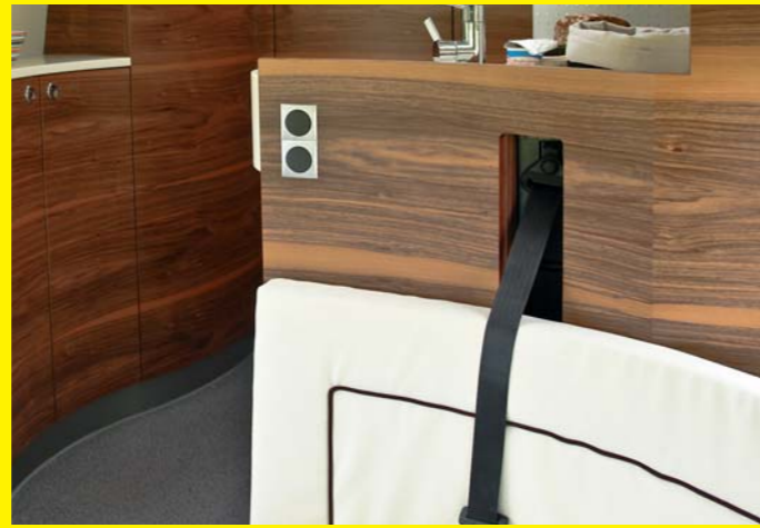
Der Gurt verschwindet bei Nichtgebrauch hinter einer Blende.

Entdecken Sie die vielen Details, die den kubus Impuls unverwechselbar machen. Alle Bedienelemente sind gut ablesbar. Die leicht zugänglichen Stauräume sind mit Filz ausgekleidet. Serienmäßig eingebaut ist eine LED-Warmtonbeleuchtung sowie Gurtsäulenabdeckung. Ausserdem sind die Wand- und Deckenbeläge ledergernarbt, was sie äußerst pflegeleicht macht. Die Badtür des kubus Impuls ist mit einer haushaltsüblichen Drückergarnitur ausgestattet. Ausserdem erhalten sie optional den LCD-Fernseher, der sich elegant ins Design der Möbel einfügt.