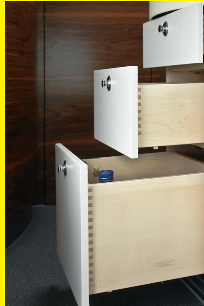
Gezinkte Schubkästen mit Softeinzug, belastbar mit 30 kg

Die Fotos zeigen die Sonderausstattung »Möbeldekor exclusiv« in franz. Nussbaum.