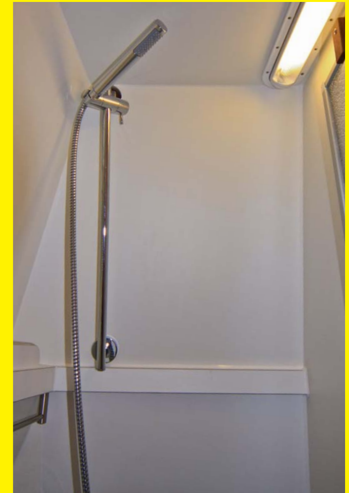
Separate Dusche mit Duschtrennwand.