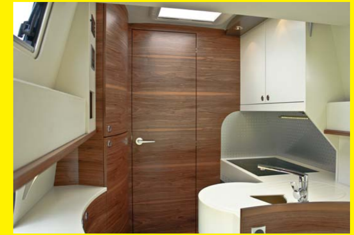
funktionelle, großzügige Küche