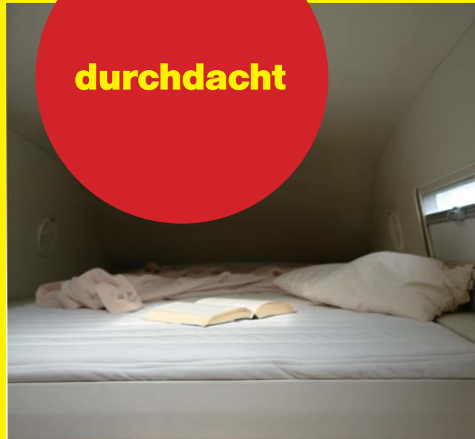
Das Dachbett ist mit einer hochwertigen Kaltschaummatratze ausgestattet.