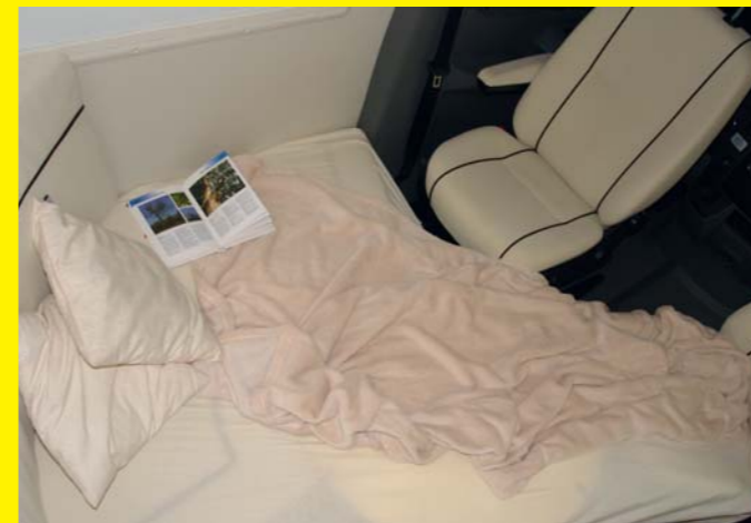
Optional entsteht aus der Sitzgruppe ein dritter Schlafplatz